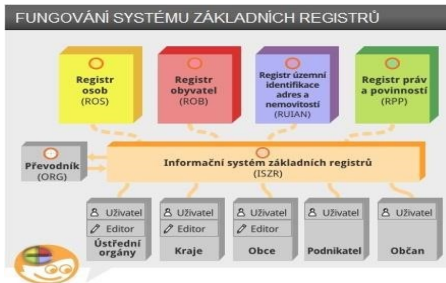
Obrázek 1: Zjednodušený popis fungování systému základních registrů

Zjednodušený popis fungování systému základních registrů (obr. 1), kde jsou jako uživatelé základních registrů znázorněni: OVM (na obrázku jsou to „Ústřední orgány“, „Kraje“ a „Obce“), právnické osoby (na obrázku jako „Podnikatel“) a fyzické osoby (na obrázku jako „Občan“).